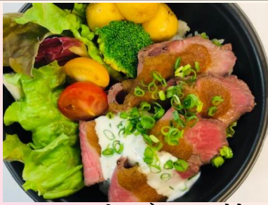
ローストビーフ丼 1.5倍！ 肉増し+¥300 ¥1000