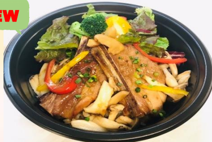
ポークスペアリブと 松茸入りきのこ丼 ¥1000

口の中でとろけるポークスペアリブと 秋の味覚きのこをふんだんに使用した 丼ぶりが新登場！