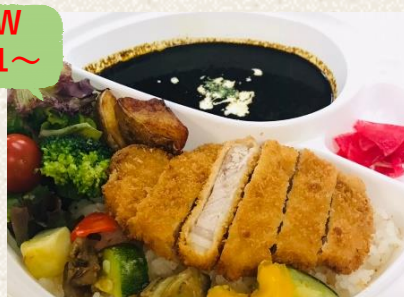
カツカレー ルー増し+¥200 ¥1100