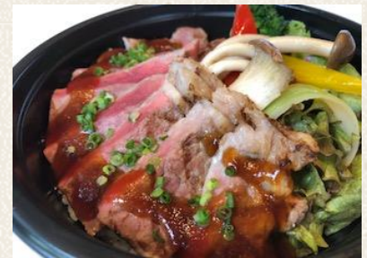
ステーキ丼 肉増し+¥300 ¥1200