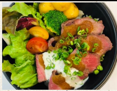
ローストビーフ丼 肉増し+¥300 ¥1000