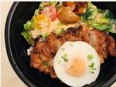
チキン醤油竜田揚げ丼 ¥800