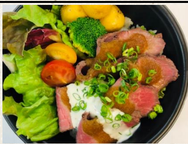
1.5倍 | ローストビーフ丼 肉増し+¥300 ¥1000