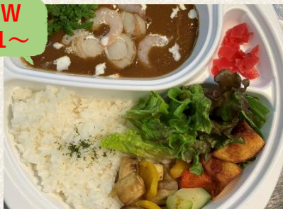
シーフードカレー ルー増し+¥200 ¥1100