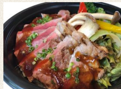
1.5倍 | ステーキ丼 肉増し+¥300 ¥1200